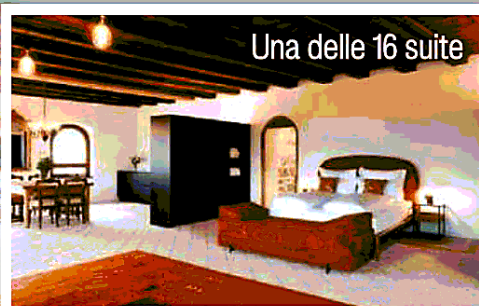
Una delle 16 suite