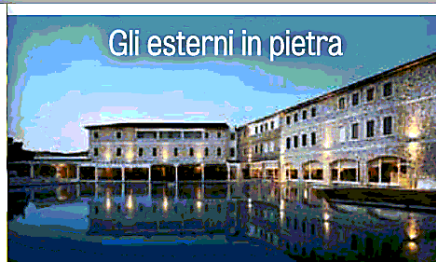
Gli esterni in pietra