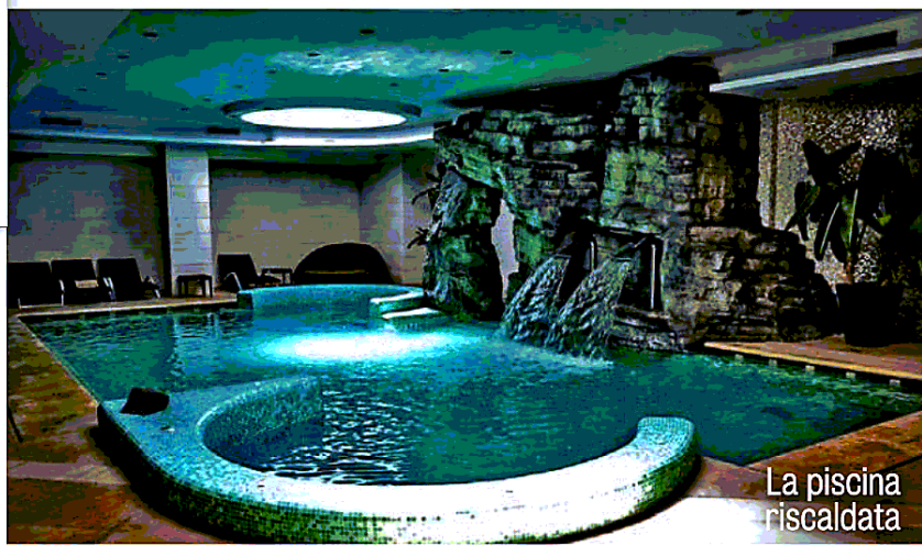
La piscina riscaldata

ESCLUSIVITÀ Sopra, una panoramica di Il Picciolo Etna Golf Resort & Spa. A sin., la splendida vista sul vulcano e, più a sin., il campo da 18 buche. A ds., dal basso, la Spa, una suite e uno dei ristoranti. Sotto, a ds., lo Schloss Freudenstein, con il campo da golf da 9 buche, la cappella privata e una delle 16 suite. Sotto, a sin., il Resort Terme di Saturnia, immerso in un parco termale di 120 ettari, nel cuore della Maremma, con il campo da 18 buche, gli splendidi esterni, i tavolini a bordo piscina e una delle camere di design. Nell'altra pagina, a sin., lo spettacolare campo da golf da 27 buche, la Club House e una delle camere matrimoniali del Golf Hotel Castelconturbia.