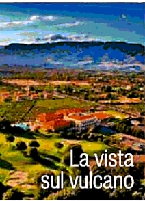
La vista sul vulcano

Prezzi Notte in doppia a partire da 60 euro a persona. Info: ilpiccioloetnagolfresort.com