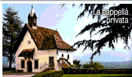
La cappella privata