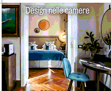
Design nelle camere